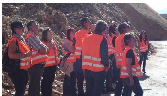
Führung durch die Firma Egger in St. Johann im Tirol