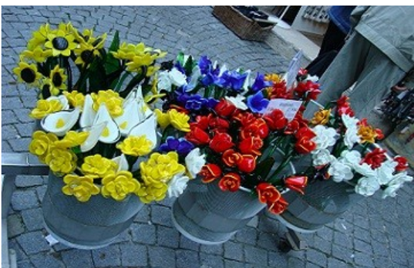
Glasblumen in Rattenburg